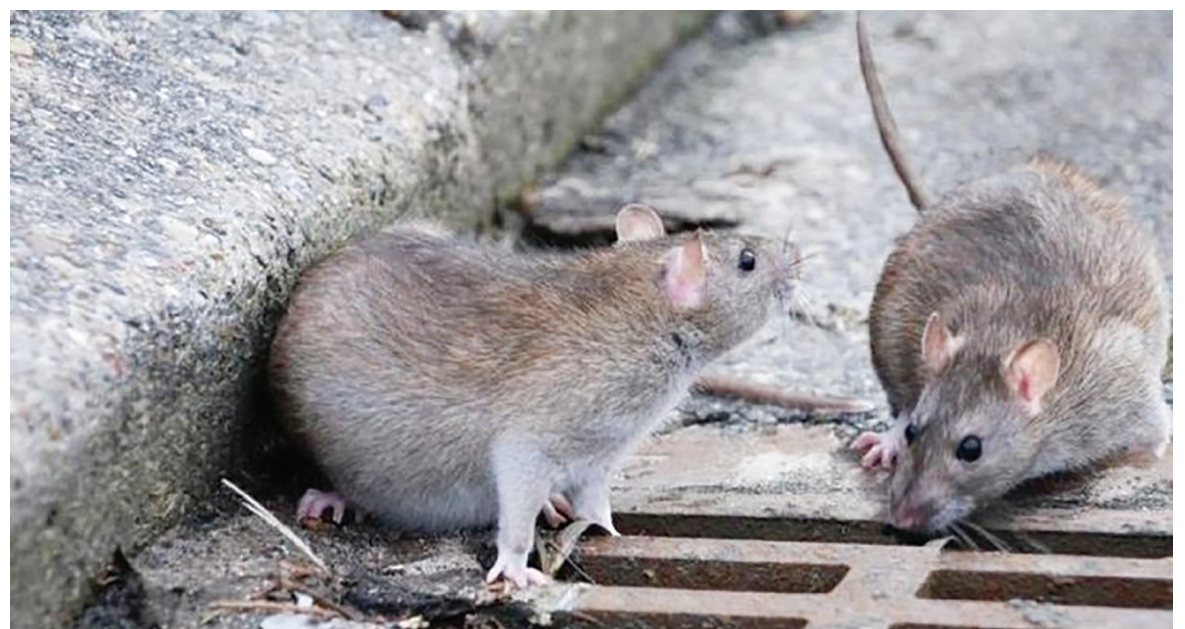
Дайындаған Нұрлан ҚОСАЙ